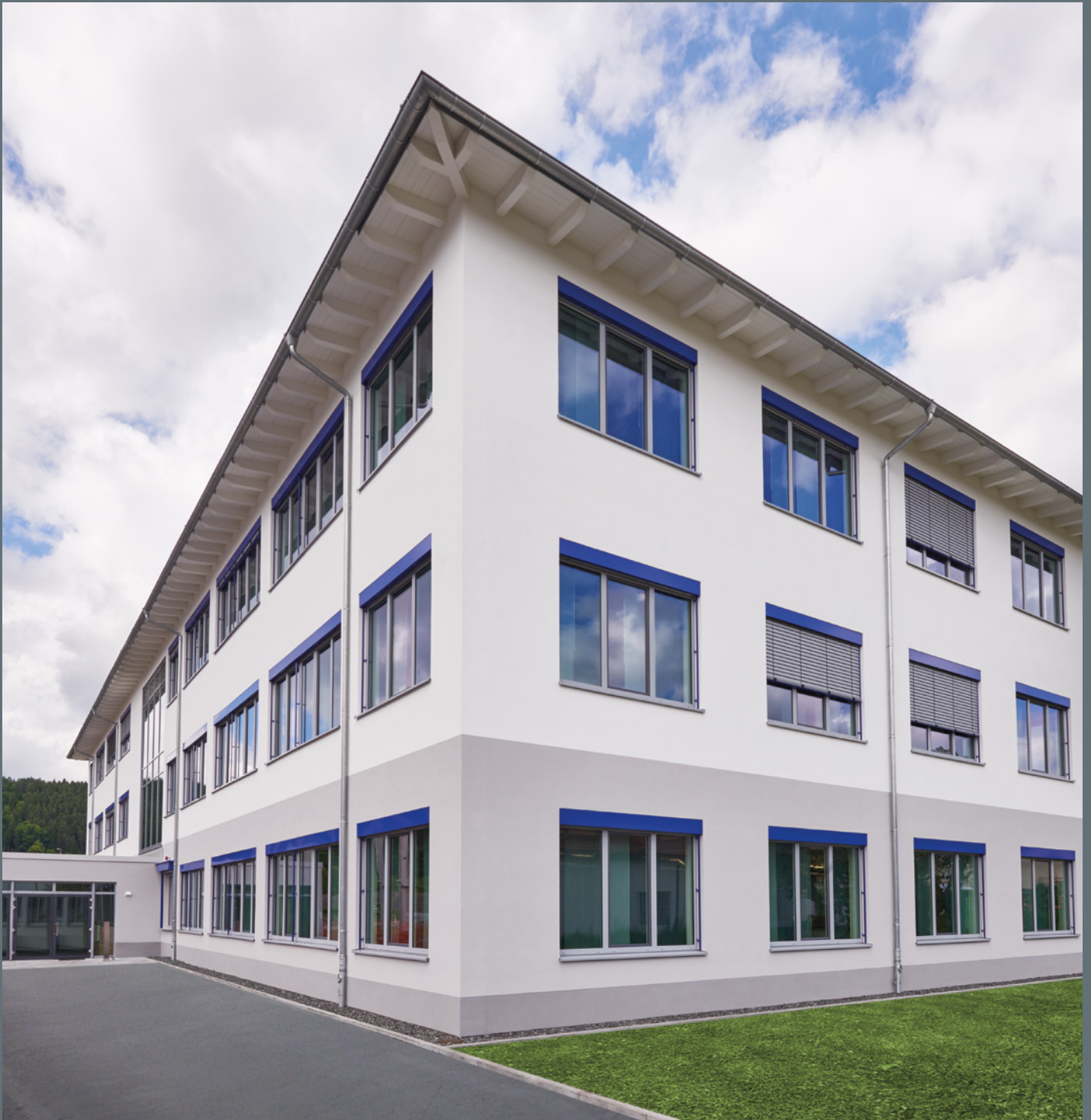
DR. SCHNEIDER F&E CENTER, KRONACH