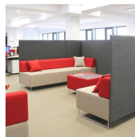
Durch verkettbare Elemente individuell erweiterbar