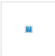
Optional mit geschraubter oder geklebter Bodenbefestigung