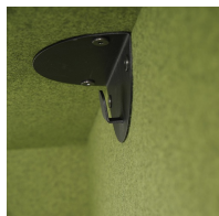
Mit zwei Kleiderhaken, links und rechts