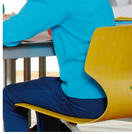
Ergonomisch und orthopädisch angepasste Schalenform