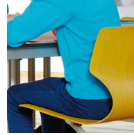
Ergonomisch und orthopädisch angepasste Schalenform