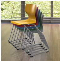
Bis zu 7 Stühle stapelbar (ohne Polster)