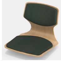
Optional mit Sitz- und Rückenpolster (nur Gr. 6E, 7)