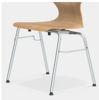
Robustes 4-Bein Gestell