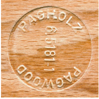
PAGHOLZ® aus nachhaltiger Forstwirtschaft