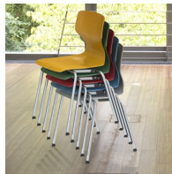
Bis zu 8 Stühle stapelbar (ohne Polster)