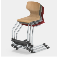
Bis zu 3 Stühle stapelbar