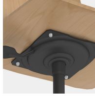
Höhenverstellung durch Sicherheitsgasfeder