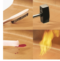
Unverwüstliche PAGHOLZ®-Schale, kratz-, bruch-, stoßfest und hitzebeständig