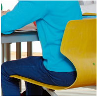
Ergonomisch und orthopädisch angepasste Schalenform