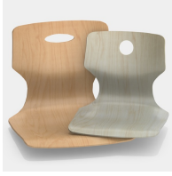
Optional mit Griffloch, rund oder oval