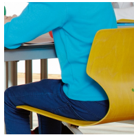
Ergonomisch und orthopädisch angepasste Schalenform