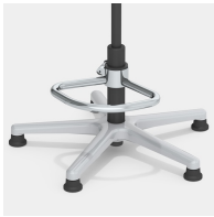
Optional mit Teilfußring