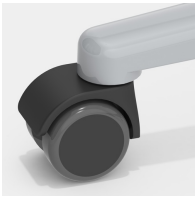
Optional mit lastabhängig gebremsten Rollen