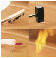
Unverwüsthliche PAGHOLZ®-Schale, kratz-, bruch-, stoßfest und hitzebeständig