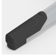
Robuste Kunststoff-Bodenschoner mit Trittschutz