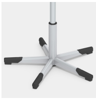
Absolut robustes Stahl-Fußkreuz