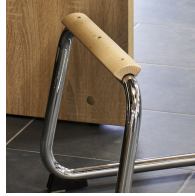
Fußstütze natur lackiert