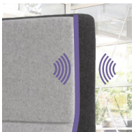
Schallschutz durch schallabsorbierenden Schaumstoff in Rückenlehne