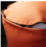
Bezug durch Reißverschluss abnehmbar