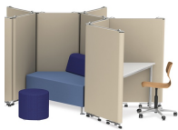
Flexible Zonierung des Raums