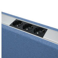
Optionales Elektroset mit 3-fach Schukosteckdose