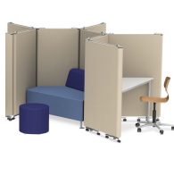
Flexible Zonierung des Raums