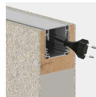
Inklusive Kabelkanal für optionales Elektroset