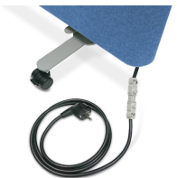
Optional mit Elektroset (nach Euronorm)