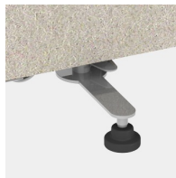
Drehbarer Ausleger mit Kunststoff-Standfüßen