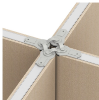
Bis zu vier Wände in einem Punkt verkettbar