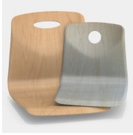
Optional mit Griffloch, rund oder oval (nicht mit Rückenpolster)