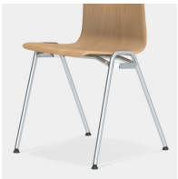
Robustes 4-Bein Gestell