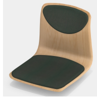
Optional mit Sitz- und Rückenpolster (nur Gr. 6E, 7)