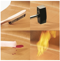
Unverwüslliche PAGHOLZ®-Schale, kratz-, bruch-, stoßfest und hitzebeständig