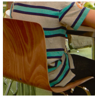
Ergonomisch geformte und flexible Schalenform