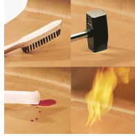
Unverwüsthliche PAGHOLZ®-Schale, kratz-, bruch-, stoßfest und hitzebeständig