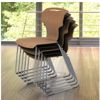
Bis zu 7 Stühle stapelbar (ohne Polster)