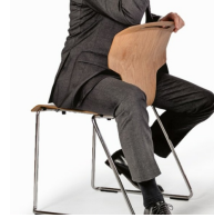
Schalen-Design erlaubt verschiedene Sitzpositionen, auch beim umgekehrten Sitzen