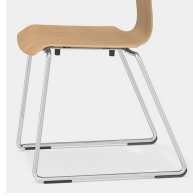
Filigranes, stabiles Gleitkufengestell