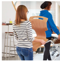
Einfach zu Tragen durch leichtes Gewicht