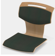
Optional mit Sitz- und Rückenpolster