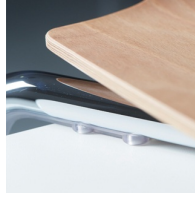
Platten- und Kantenschoner schützen den Tisch beim Aufstuhlen