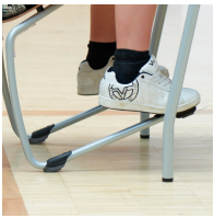
Robustes C-Form Gestell mit ASS FLOORSAFE® Bodenschoner