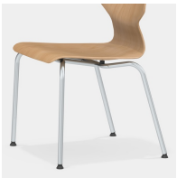
Robustes 4-Bein Gestell