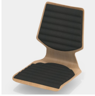
Inklusive Sitz- und Rücken-Wellenpolster