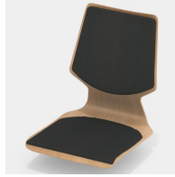
Optional mit Sitz- und Rücken-Flachpolster