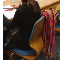
Besonders hohe Rückenlehne steigert den Sitzkomfort