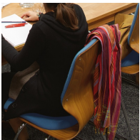
Besonders hohe Rückenlehne steigert den Sitzkomfort