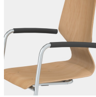
Inklusive Armlehne mit schwarzem Softgrip-Überzug