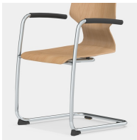
Robustes Freischwinger-Gestell mit Armlehne