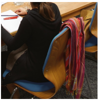
Besonders hohe Rückenlehne steigert den Sitzkomfort