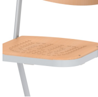
Sitzfläche mit eingepressten, rutschhemmenden Noppen