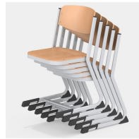
Bis zu 5 Stühle stapelbar (Gr. 2-6)