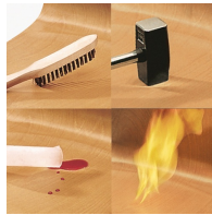
Sitz und Rücken melaminharzbeschichtet: kratz-, bruch-, stoßfest & schwer entflammbar