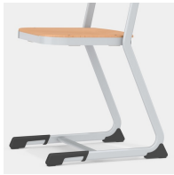
Stabiles und massives C-Form Kufengestell