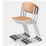
Bis zu 3 Stühle stapelbar (Gr. 7)