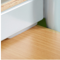
Plattenschoner schützen den Tisch beim Aufstuhlen