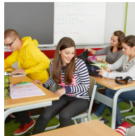
Kein Stören der Stuhlbeine beim Ein- und Aussteigen