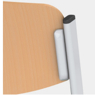
Sitz und Rücken verdeckt verschraubt