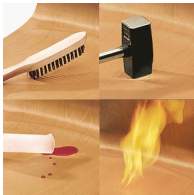
Sitz und Rücken melaminharzbeschichtet: kratz-, bruch-, stoßfest & schwer entflammbar