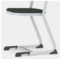
Stabiles und massives C-Form Kufengestell