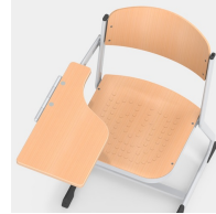
Stabiles und massives C-Form Kufengestell mit Schreibauflage