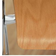
Sitzschale umweltfreundlich lackiert mit Lack auf Wasserbasis