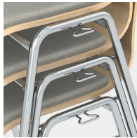
Bis zu 9 Stühle stapelbar (auch mit Sitzpolster)