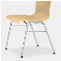
Robustes 4-Bein Gestell