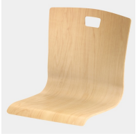
Optional mit Griffloch in Trapezform (nicht mit Rückenpolster)