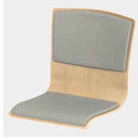
Optional mit Sitz- und Rückenpolster