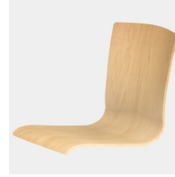
Körpergerecht geformte Sitzschale