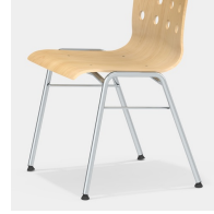
Robustes 4-Bein Gestell