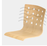
Sitzschale mit runden Ausstattungen sorgt für optimale Luftzirkulation