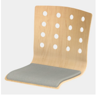
Optional mit Sitzpolster