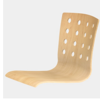
Körpergerecht geformte Sitzschale