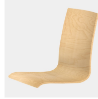
Körpergerecht geformte Sitzschale