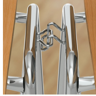
Gestell inklusive Reihenverbindung