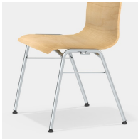
Robustes 4-Bein Gestell