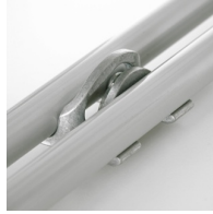
Optional mit Reihenverbindung ab Größe 5