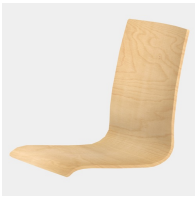
Körpergerecht geformte Sitzschale