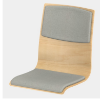
Optional mit Sitz- und Rückenpolster