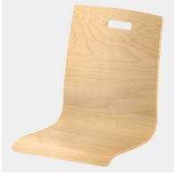
Optional mit rechteckigem Griffloch (nicht mit Rückenpolster)