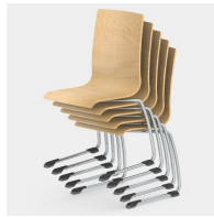
Bis zu 5 Stühle stapelbar (ohne Polster)