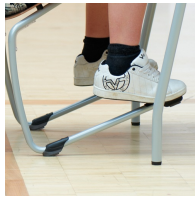
Robustes C-Form Gestell mit ASS FLOORSAFE® Bodenschoner