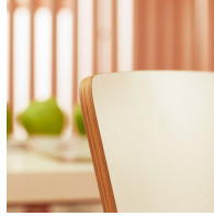
Sitzschale optional mit kratzfestem Multiplex Dekor beschichtet