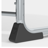
Kippschutz durch spezielle Bodenschoner