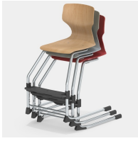
Bis zu 3 Stühle stapelbar