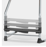
Werkzeuglose Verstellung der Fußraste mit nur einer Hand