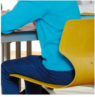
Ergonomisch und orthopädisch angepasste Schalenform