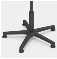
Absolut robustes Kunststoff-Fußkreuz in schwarz