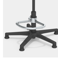
Optional mit Teilfußring