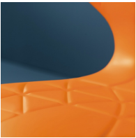
Sitzschale mit integrierten Lüftungskanälen