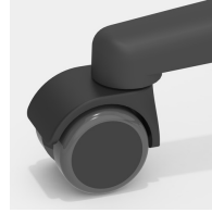
Optional mit lastabhängig gebremsten Rollen