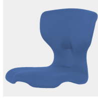
Optional Sitzschale Vollpolster ab Größe 5