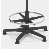
Erhöhung mit verchromtem Fußring, höhenverstellbar