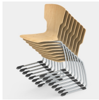
Bis zu 8 Stühle stapelbar (ohne Polster)