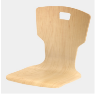
Optional mit Griffloch in Trapezform (nicht mit Rückenpolster)