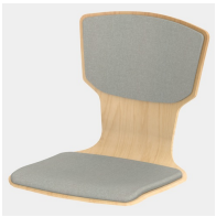
Optional mit Sitz- und Rückenpolster