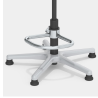
Optional mit Teilfußring