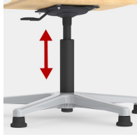
Höhenverstellung durch Sicherheitsgasfeder