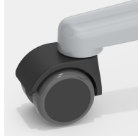
Optional mit lastabhängig gebremsten Rollen