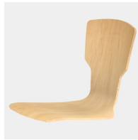
Körpergerecht geformte Sitzschale