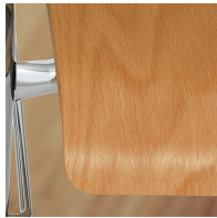
Sitzschale umweltfreundlich lackiert mit Lack auf Wasserbasis