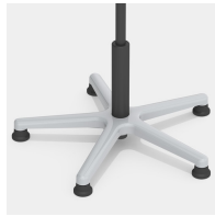
Absolut robustes Alu-Fußkreuz