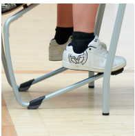
Robustes C-Form Gestell mit ASS FLOORSAFE® Bodenschoner