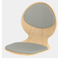
Optional mit Sitz- und Rückenpolster