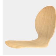
Körpergerecht geformte Sitzschale