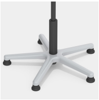
Absolut robustes Alu-Fußkreuz