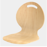
Optional mit Griffloch in Nierenform (nicht mit Rückenpolster)