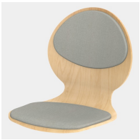
Optional mit Sitz- und Rückenpolster