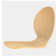
Körpergerecht geformte Sitzschale