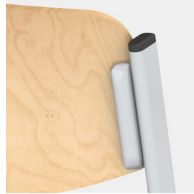
Sitz und Rücken verdeckt verschraubt