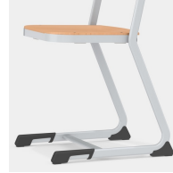
Stabiles und massives C-Form Kufengestell