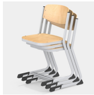
Bis zu 3 Stühle stapelbar (Gr. 7)