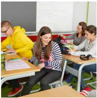
Kein Stören der Stuhlbeine beim Ein- und Aussteigen