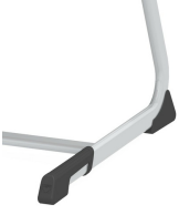
Bodenschoner mit integriertem Trittschutz