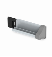
Unsichtbare Schienen-Befestigung gleicht Wandunebenheiten aus