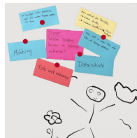
Magnetaftende Oberfläche mit Whiteboard-Stiften beschreibbar