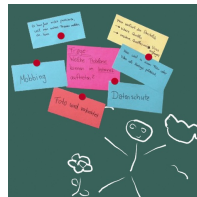
Magnetaftende Oberfläche mit Kreide beschreibbar