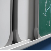
Tafel-Elemente mit ASSODUR®-Kante hintereinander verschiebbar