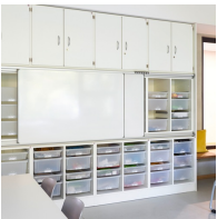
Montierbar an Schrankwand