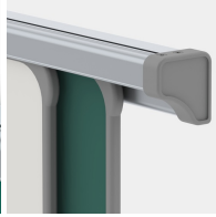
Kunststoffkappen verhindern unbeabsichtigtes Herausstoßen Elemente