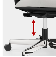
Stufenlose Gaslifthöhenverstellung inkl. Sitztiefenfederung