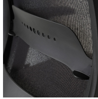
Netzrückenlehne schwarz, mit Lordosenstützverstellung