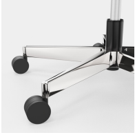
Elegantes, hochwertiges Alu-Fußkreuz