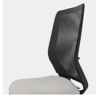
Ergonomisch geformte, atmungsaktive Netzrückenlehne