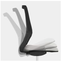
Selbstwiegende Synchronmechanik passt Federkraft bzw. Widerstand automatisch an