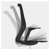
Selbstwiegende Synchronmechanik passt Federkraft bzw. Widerstand automatisch an