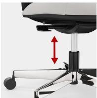
Stufenlose Gaslifthöhenverstellung inkl. Sitztieffenfederung