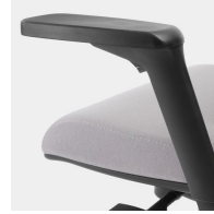
Armlehne dreidimensional verstellbar