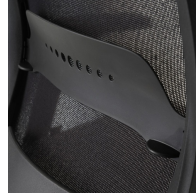
Netzrückenlehne schwarz, mit Lordosenstützverstellung