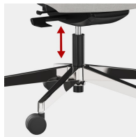
Stufenlose Gaslifthöhenverstellung inkl. Sitztiefenfederung