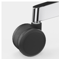
Lastabhängig gebremste Sicherheitsrollen verhindern ungewolltes Wegrollen