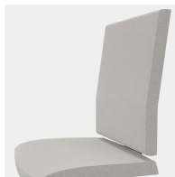
Ergonomisch geformte Rückenlehne