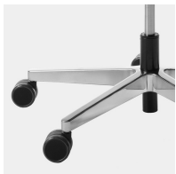
Elegantes, hochwertiges Alu-Fußkreuz