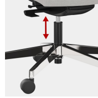
Stufenlose Gaslifthöhenverstellung inkl. Sitztiefenfederung