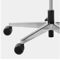
Elegantes, hochwertiges Alu-Fußkreuz