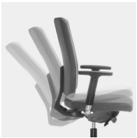
Selbstwiegende Synchronmechanik passt Federkraft bzw. Widerstand automatisch an