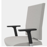
Ergonomisch geformte Rückenlehne