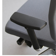
Armlehne dreidimensional verstellbar