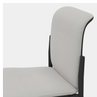
Ergonomisch geformte Rückenlehne