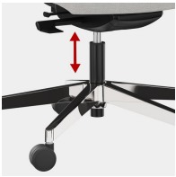
Stufenlose Gaslifthöhenverstellung inkl. Sitztiepenfederung