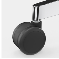
Lastabhängig gebremste Sicherheitsrollen verhindern ungewolltes Wegrollen