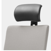
Kopfstütze mit Lederbezug: Höhe und Neigungswinkel verstellbar