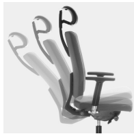
Selbstwiegende Synchronmechanik passt Federkraft bzw. Widerstand automatisch an