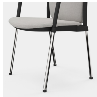
Robustes 4-Bein Gestell