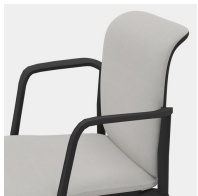
Ergonomisch geformte Rückenlehne